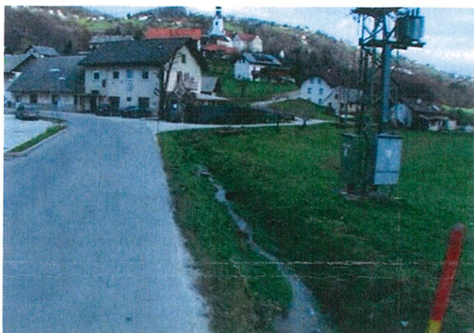
Slika 2: Območje ob gasilnem domu

in pri tem ob robu vozišča, robom robnega ali odstavnega pasu ni izveden robnik višine 15 cm < h < 18 cm.